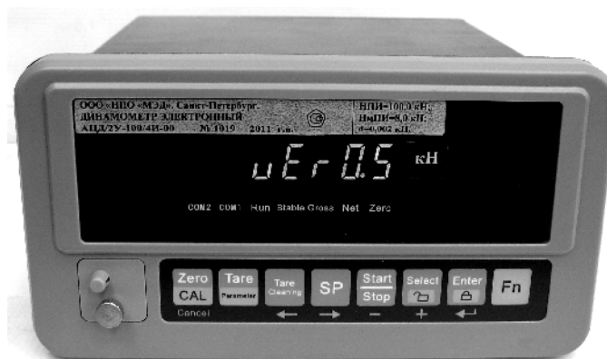
Рисунок 1. Внешний вид электронного блока с изображением версии программного обеспечения.

Т – вариант исполнения упругого элемента (1; 2; 3; 4; 5; 6; 7 приведен на рисунке 2).