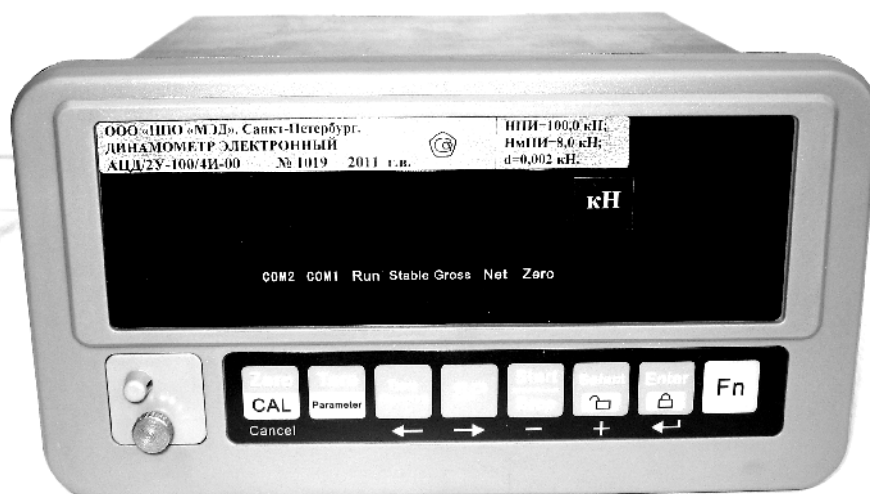
Рисунок 3. Схема пломбировки от несанкционированного доступа и обозначение места для нанесения оттиска клейма.