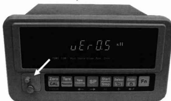
Рисунок 1 - Схема пломбировки электронных блоков типа 6 (Место навешивания ударной пломбы указано стрелкой)

Примечание - При поверке после ремонта целостность и наличие ударной пломбы не проверять. В этом случае после проведения поверки при получении её положительных результатов установить новую ударную пломбу с оттиском поверительного клейма на место, показанное на рисунке 1 (см. также п. 12.1.1).